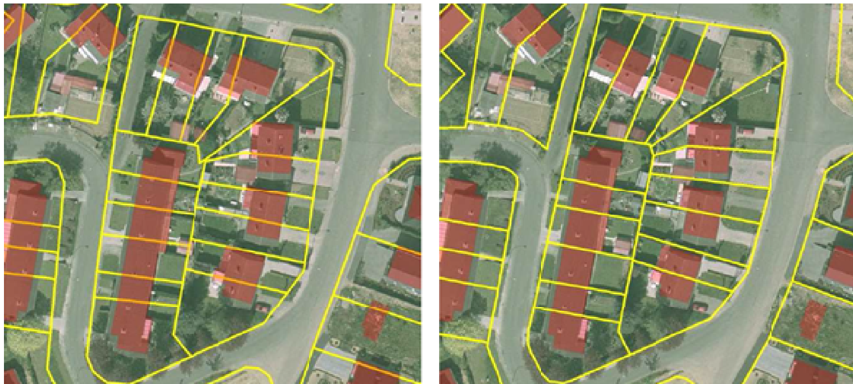
Plan cadastral wallon précisé géométriquement